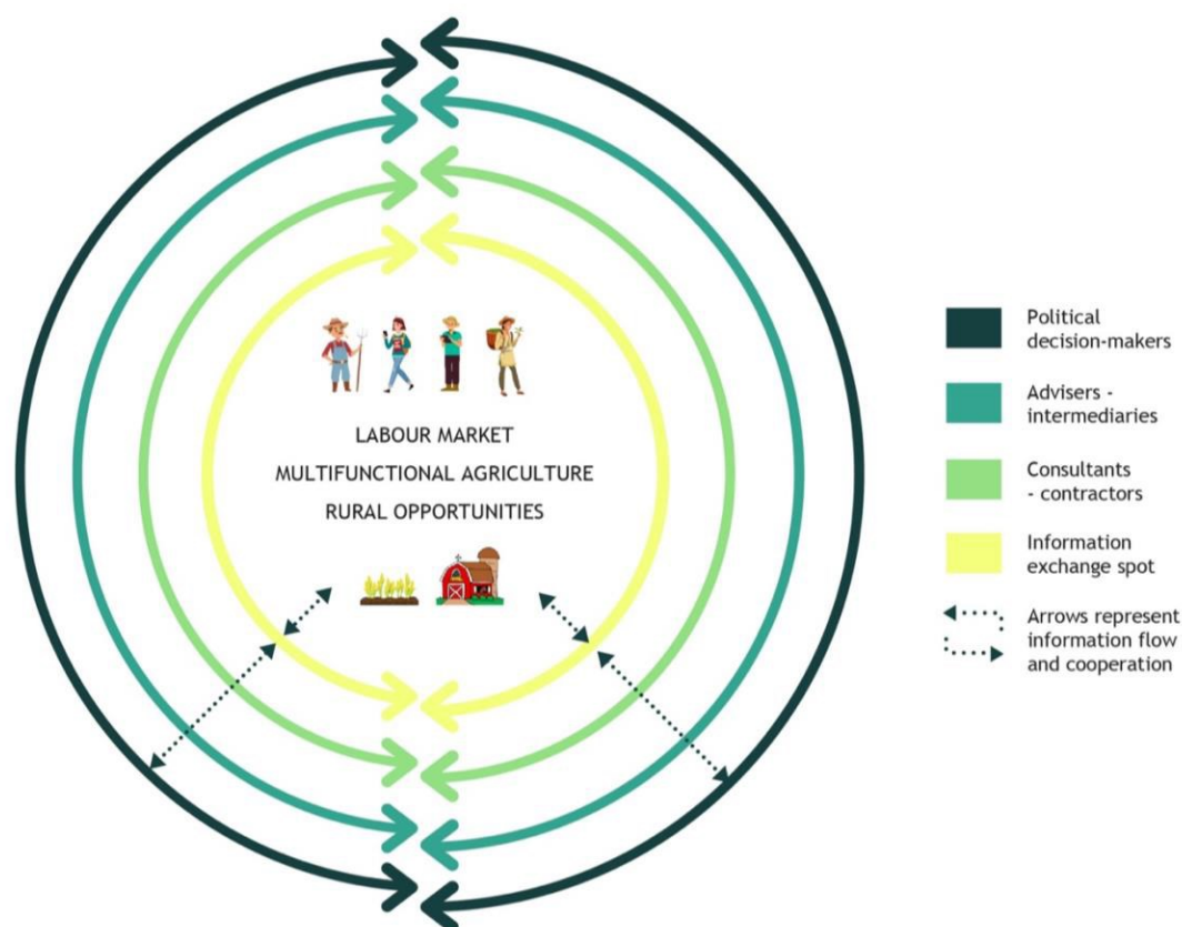
Figure 2: Nov model kariernega svetovanja

Osrednji del modela je trg dela na področju večnamenskega kmetijstva: