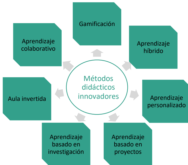
Figura 1: Ejemplos de Métodos de Enseñanza Innovadores

En el paisaje educativo en constante evolución, están surgiendo tendencias innovadoras en la enseñanza para mejorar las experiencias de aprendizaje, optimizar los resultados de los estudiantes y abordar las diversas necesidades de los alumnos. Un docente innovador abraza el cambio, aprovecha las nuevas tecnologías e implementa métodos de enseñanza creativos para mejorar el aprendizaje de los estudiantes. Los métodos de enseñanza innovadores (Fig. 1) y los sistemas de gestión del aprendizaje (Fig. 2) reflejan un giro hacia un enfoque más dinámico, inclusivo y personalizado de la educación, proporcionando a los docentes una plataforma para crear y entregar contenido, monitorear la participación estudiantil y evaluar el rendimiento de los estudiantes, fomentando el compromiso y mejorando los resultados del aprendizaje.