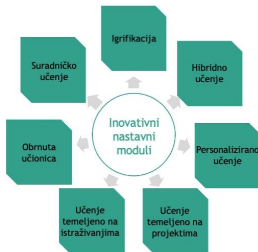
Slika 1: Primjer inovativnih metoda poučavanja

U obrazovnom okruženju koje se brzo razvija, inovativni trendovi u poučavanju neprestano se pojavljuju kako bi poboljšali iskustva učenja te rezultate učenika i odgovorili na njihove različite potrebe. Inovativni nastavnik prihvaća promjene, koristi nove tehnologije i primjenjuje kreativne metode poučavanja kako bi poboljšao učenje učenika. Inovativne metode poučavanja ( Slika 1 ) i sustavi upravljanja učenjem ( Slika 2 ) odražavaju pomak prema dinamičnijem, inkluzivnijem i personaliziranijem pristupu obrazovanju, pružajući nastavnicima platformu za stvaranje i isporuku sadržaja, praćenje sudjelovanja učenika i ocjenjivanje uspješnosti učenika, poticanje angažmana i poboljšanje ishoda učenja.